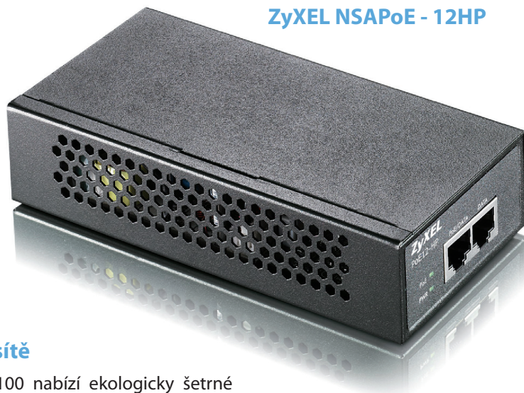
ZyXEL NSAPoE - 12HP

Vzhledem k integrovaným montážním úchytům mohou být tato stolní zařízení umístěna také do síťového rozvaděče (racku). Bez ohledu na to, jak velké nároky na síť podnik má, řada ZyXEL ES1100 je uspokojuje prostřednictvím cenově dostupného a spolehlivého síťového řešení, které je určeno speciálně malým podnikům.